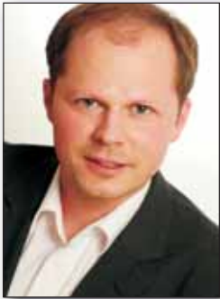
Prof. Dr. Ulrich Trautwein Tübingen

Frühe Bildung im Sinne einer gezielten Förderung schulrelevanter Kompetenzen im Vorschul- und frühen Grundschulalter ist in jüngster Zeit zu einem zentralen Thema der pädagogischen Praxis in Kindergärten und Grundschulen geworden. Nicht selten ist mit der frühen gezielten Förderung schulrelevanter Kompetenzen die Hoffnung verbunden, die große Heterogenität des Leistungsvermögens von jungen Menschen in den deutschsprachigen Bildungssystemen schon früh abbauen zu können, und zwar ohne die Kompetenzentwicklung der Leistungsstarken künstlich zu drosseln. Dies kann man nur erreichen, wenn man weiß, bei welchen Kindern im Vorschulalter Entwicklungsrückstände schulisch relevanter Kompetenzen vorliegen. Dazu bedarf es einer zuverlässigen frühen Diagnose, die eine Prognose der schulisch erfolgreichen Weiterentwicklung erlaubt. Aber ist dies überhaupt leistbar?